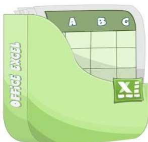
Átmeneti Adatgyűjtő Táblázat 2.0

Mint ahogy az egységes szolgáltatás-módszertan képzésen elhangzott, és az Országos Hálózati Találkozón megerősítésre került, a szolgáltatás-módszertanhoz kapcsolódó kérdéseket az egysegesm@gmail.com e-mail címre várjuk, ahol a fejlesztők közvetlenül válaszolnak a feltett kérdésekre 2014. március végéig. Kérünk minden szervezetet, éljen ezzel a konzultációs lehetőséggel!